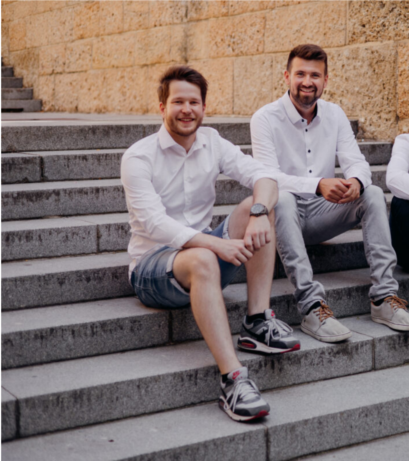
Team Kraken Innovations

Wir schaffen neue Möglichkeiten für bestehende Anwendungen, die dank unserer Antriebslösung fit für die vernetzte Produktion der Zukunft werden.